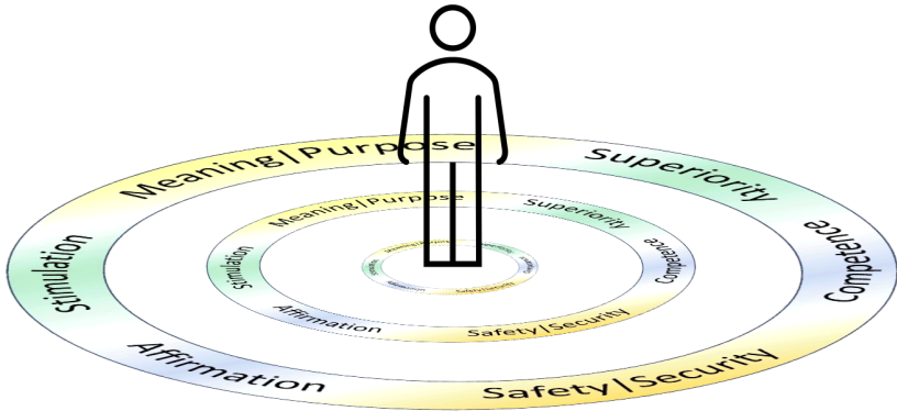
รูปที่ 2: การขยายตัวของจิตสำนึก

เราจะเปลี่ยนจากการเข้าใจจิตวิทยาของบุคคลไปสู่จิตวิทยาของส่วนรวมได้อย่างไร